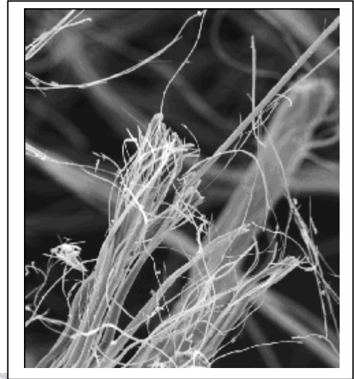
Fibre d'Amiante de type Chrysotile